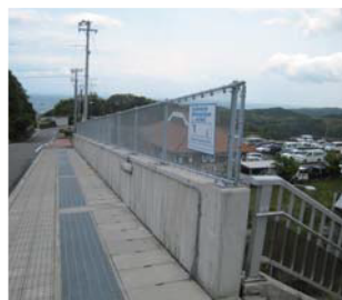
階段を上がり、右に下ります。