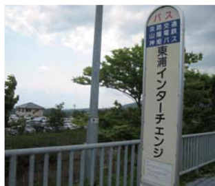
東浦インターチェンジバス停で下車します。