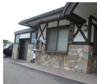
30mほど下ると右手に見えてくるのが山田原会館です。正面玄関脇の公衆電話でタクシーをお呼びください。