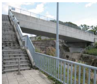
バスを降りて、左側の階段を上がります。